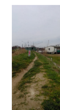
foto 3 sbarra esistente