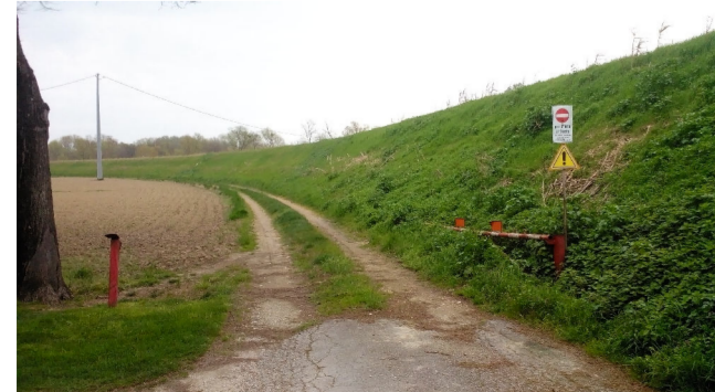
foto 8 sbarra esistente da ripristinare