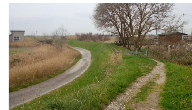
foto 5 sbarra esistente