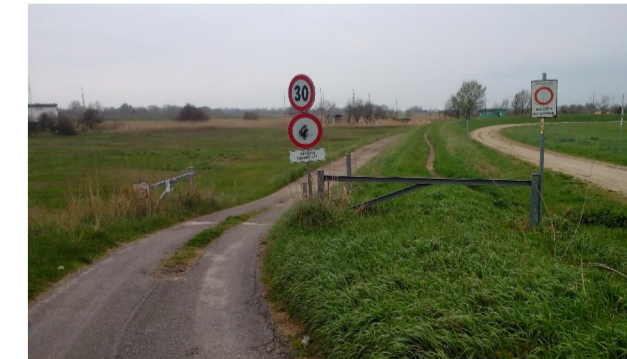
foto 6 sbarra esistente